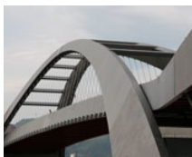
Gleisbogen Bridge (CH)