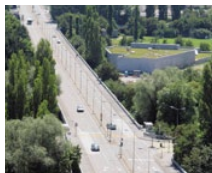
Europe Bridge (CH)