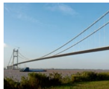
Run Yang Bridge (CN)