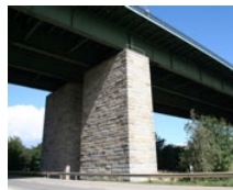
Danube Bridge Sinzing (DE)