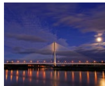
River Suir Bridge (IR)